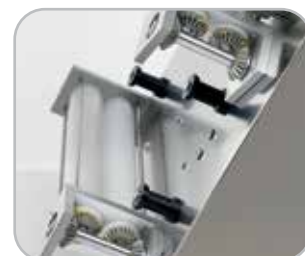
Sistema de transmissão por engrenagens metálicas