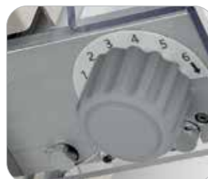
Regulagem precisa da espessura de ambos conjuntos de rolos