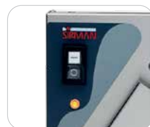
Comandos IP 54