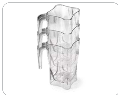
Copos quadrados empilháveis