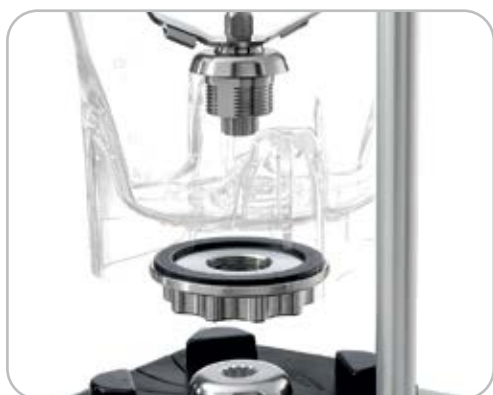
Pino de acoplamento em inox no modelo Q