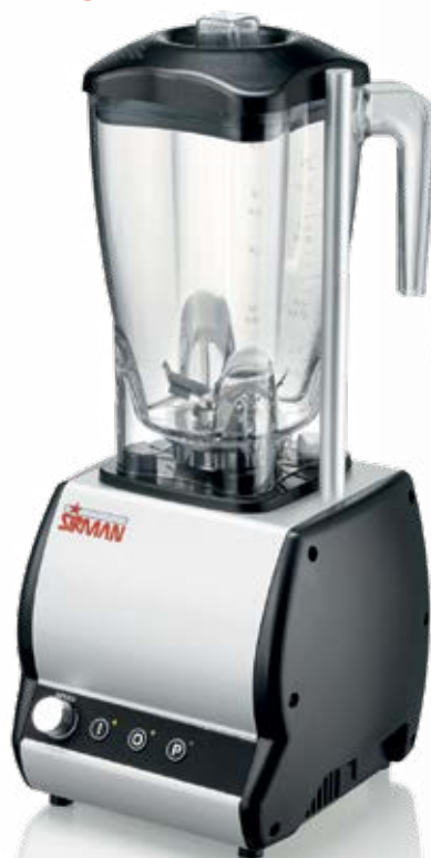
ORIONE Q VV