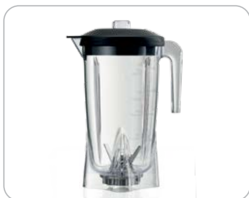
Copo redondo opcional