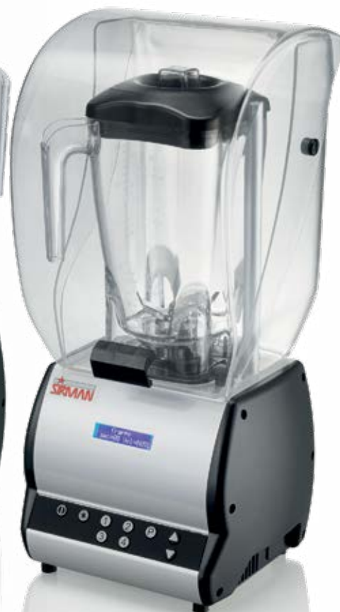
BARMASTER Q com abaflador de ruído