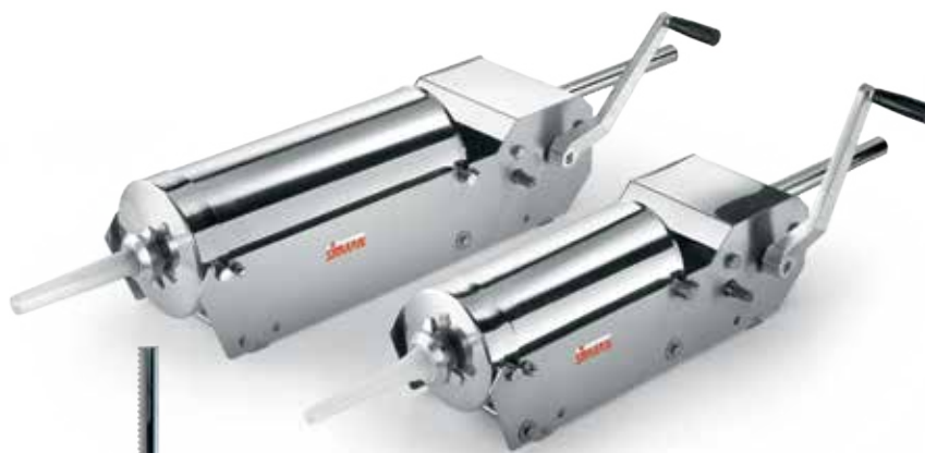
IS 8-16 X