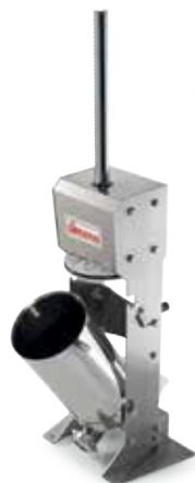
IS 12 XV