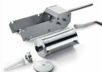
IS 8-16 X