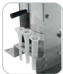
Suporte dos funis