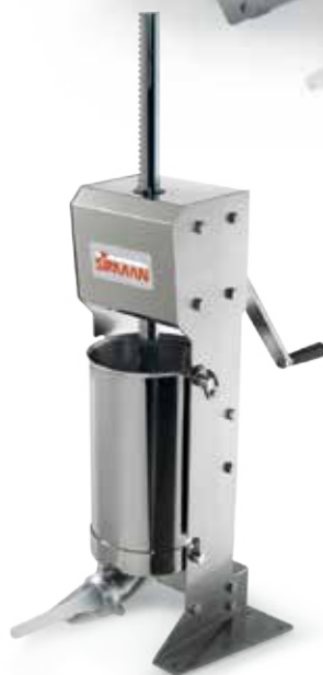
IS 12 XV